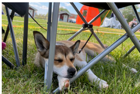
Vilja vilar gott i skuggan under stolen

Avslutningsvis kan vi berätta att även alla vi som deltog i utställningen också fick beröm: personalen på Sävsjö Camping var jättenöjda med vårt arrangemang och tyckte att det var kul att vi tog oss tid att svara på alla frågor som de och de lokala besökarna hade avseende Lunde hundar. Och de hälsade oss hjärtligt välkomna tillbaka!