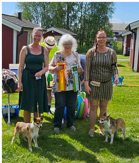
BIR Blameless Flames of Vorkosmia & BIM Ada

På kommande sidor kan ni läsa fullständiga resultat inkl kritiker.