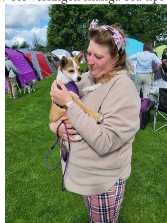
Lilla Jutta från Kennel Boromir

Efter att ha lärt känna och studerat rasen har vi bestämt oss för att lundehunden passar vår familj perfekt. Allt handlar ju så klart inte bara om att rasen skall passa in, tajmningen när man tar hem en valp är nog så viktig. Då vår blandrastik börjar bli lite till åren ville vi ta hem en valp innan hon blev för gammal för att orka. Vi ville också vänta till efter vårt planerade bröllop våren 2022, så vi kunde ge vår nya familjemedlem en så lugn och trygg start som möjligt. Detta landade i att vi ställde oss i kö för att förhoppningsvis få ta hem vår första lundehund våren 2023