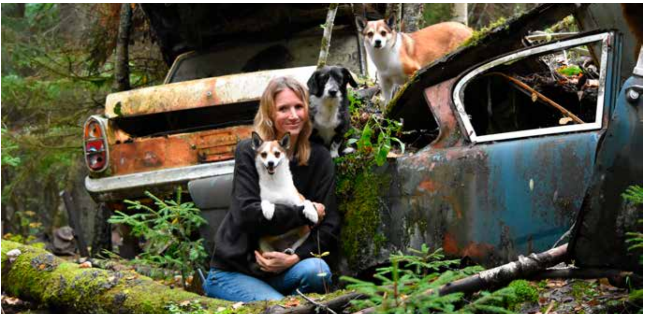
Carina, Super Magic's Fancy Star »Lix«, Clara, Super Magic's Fancy Moon »Hippo«

Det är bra att ha dessa kontakter så att vi kan hjälpa varandra, utbyta råd och ha trevliga hundmöten. Jag tycker att »lundehundsmänniskor» i allmänhet är trevliga och väldigt hjälpsamma, det är som en enda stor familj. Det är alltid kul att ses på hundutställningar och hundträffar och få en trevlig stund tillsammans med andra lundehundar och deras ägare.