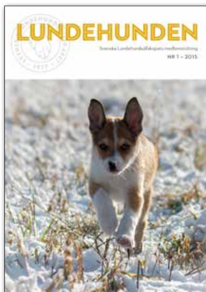
2015 blev den en proffsig tidning...och årets nr 3 blev vår sista LundeHunden!