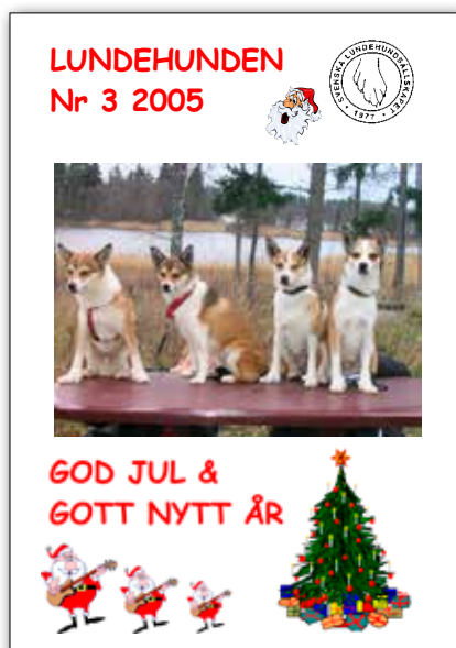
Så här såg vårt första nummer av LundeHunden ut 2005!