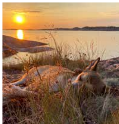
Omslagsbilden: Atle njuter i solnedgången. Lundetuvans Atle Stivsvingel.