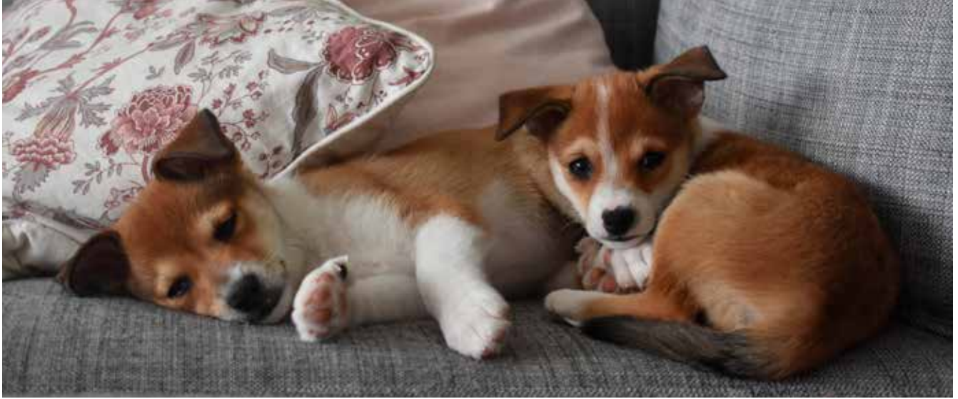
Dream Hippos Goa Neo och Dream Hippos Goa Nellie