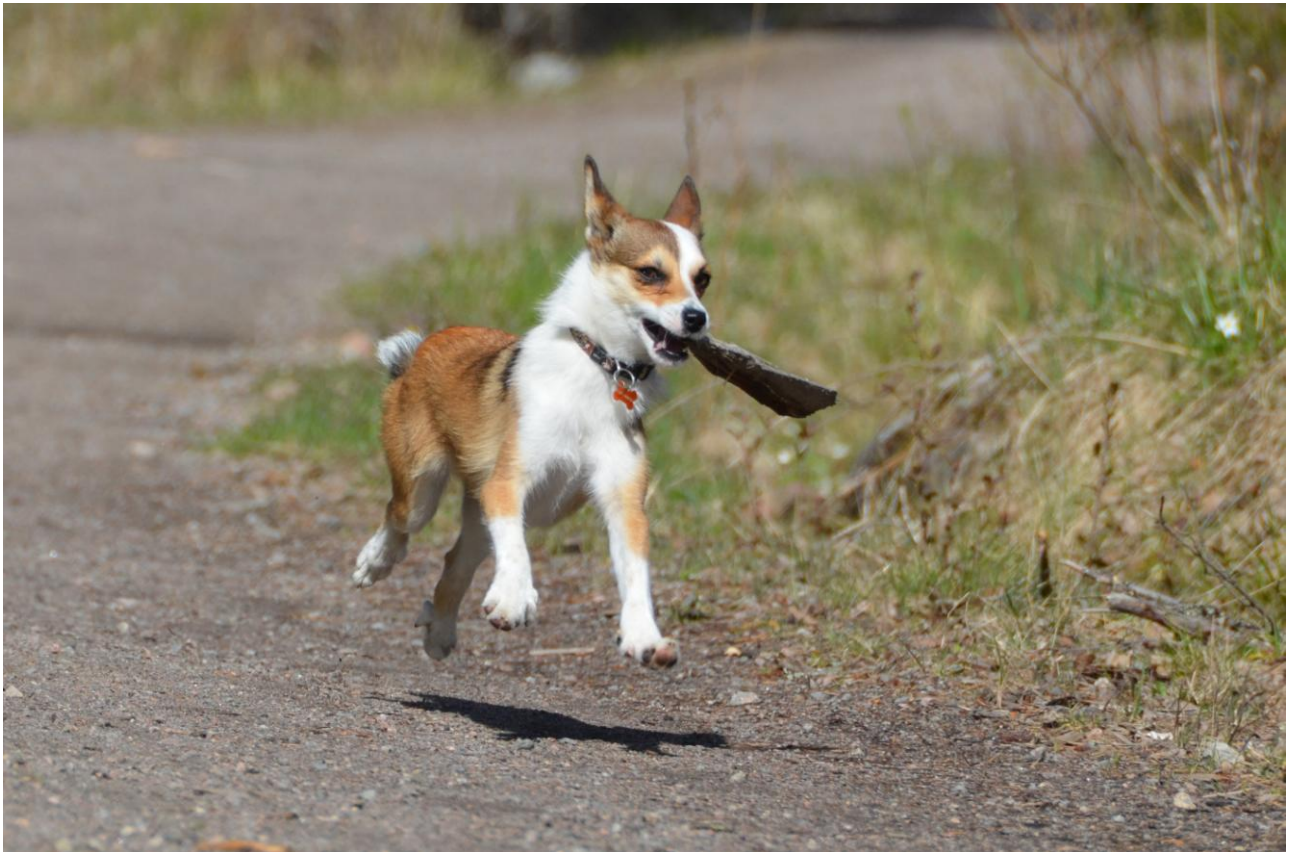
Kung Sunes Lisa