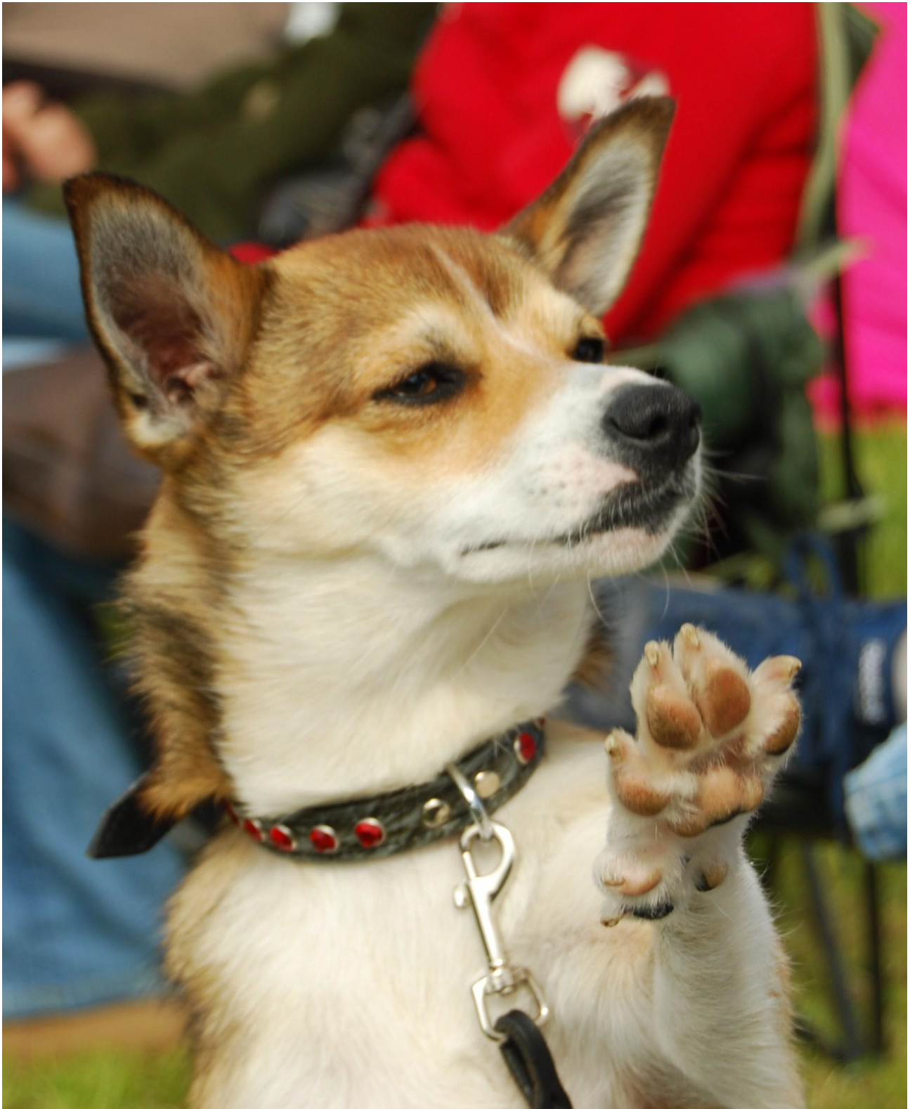
Canivas Titania