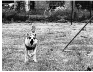
Mina på väg över hindret, godiset väntar i mattes hand. Gryla kastar sig i väg när matte kallar.