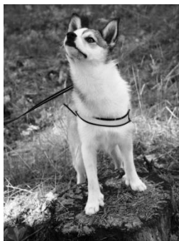
Bella njuter i skogen.