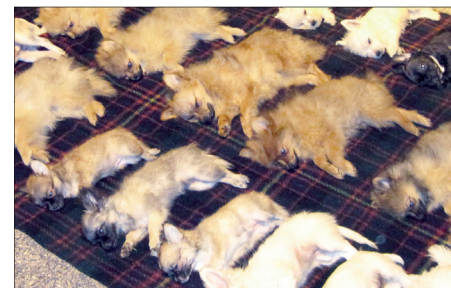
På grund av farliga sjukdommar tvingas man tyvärr ofta avliva många av hundarna.