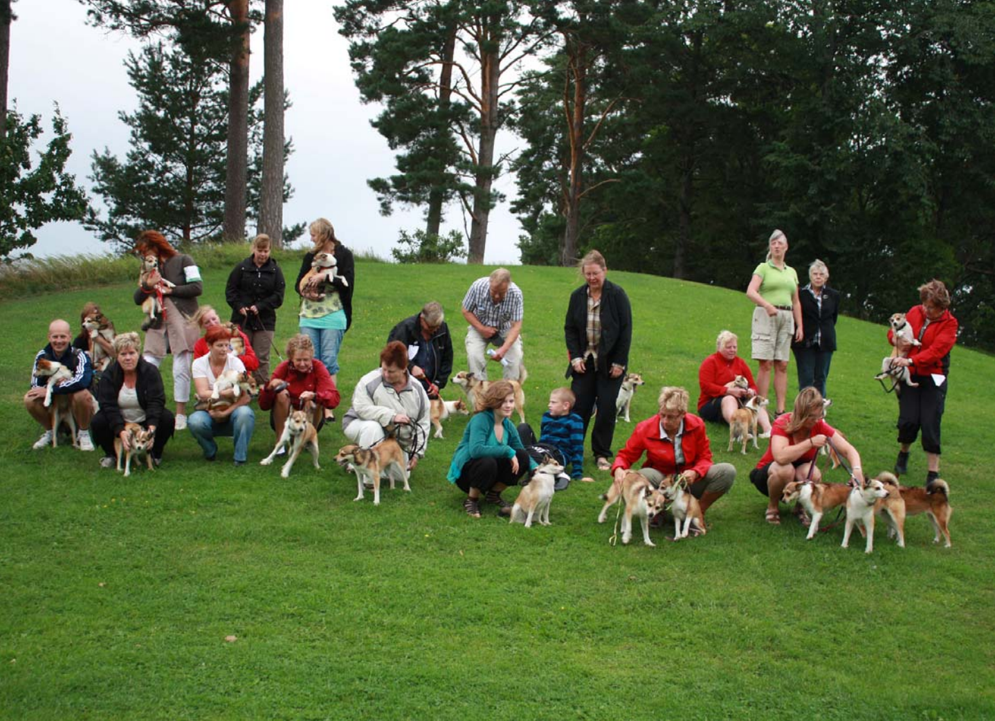
Alla deltagande lundehundar.