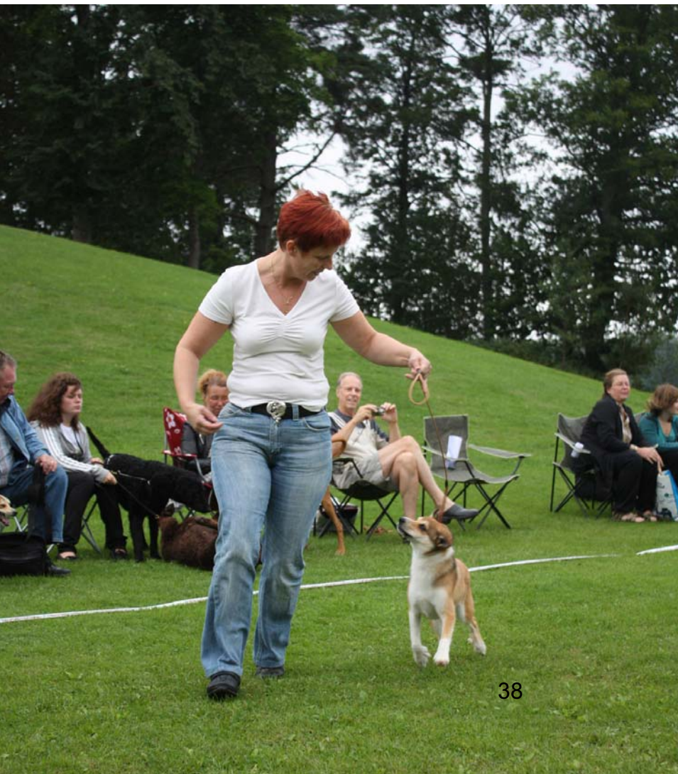
Rörek springer med matte.