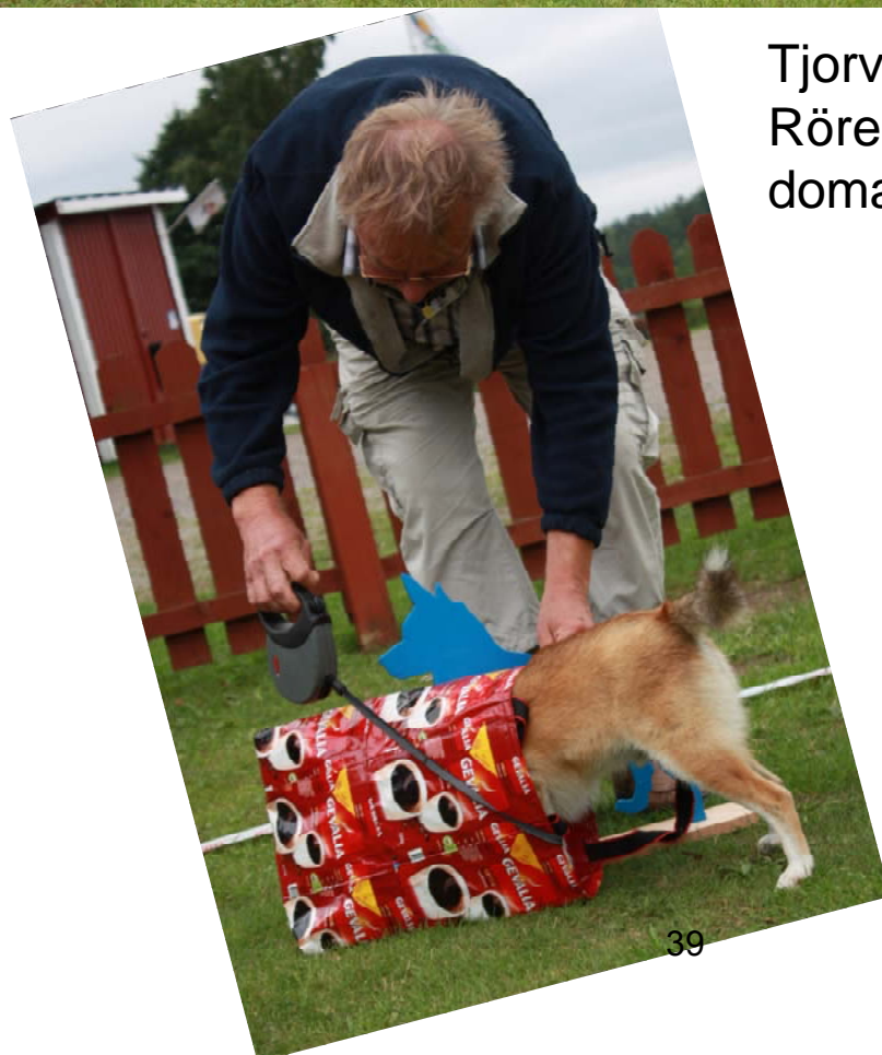
Pricken undersöker sitt pris i lundehundsracet.