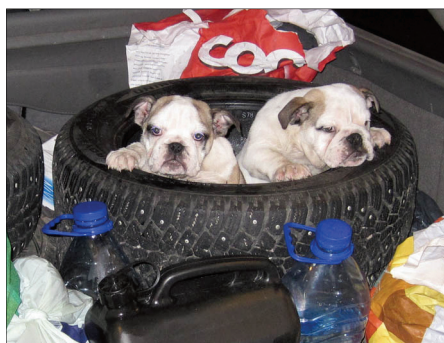
Valpar av alla raser trycks in i små utrymmen när de ska smugglas över gränserna. Dessa två hade tur och överlevde den hårda behandlingen.

Problemet är inte nytt, och har förekommit under många år. För några år sedan gjordes en stor kampanj för att upplysa allmänheten om vad som pågick, och Tullverket märkte då en positiv minskning av tillslag.