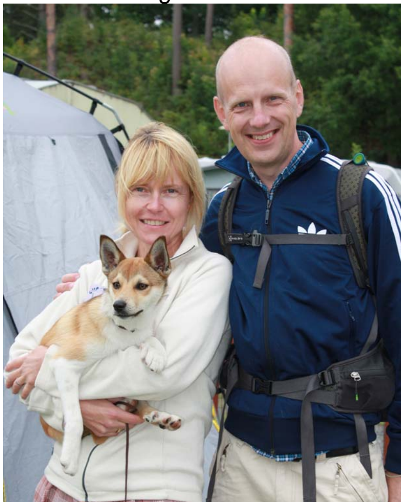
Odin i mattes famn.