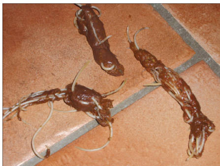
Maskfylld avföring från en beslagtagna smuggelhund. Enligt annonsen skulle den vara avmaskad.

– På detta sätt hoppas vi inte bara minska handeln med insmugglade hundar, utan även få fl er att larma polisen om de stöter på valpar som de misstänker vara insmugglade, fortsätter Fredrik.