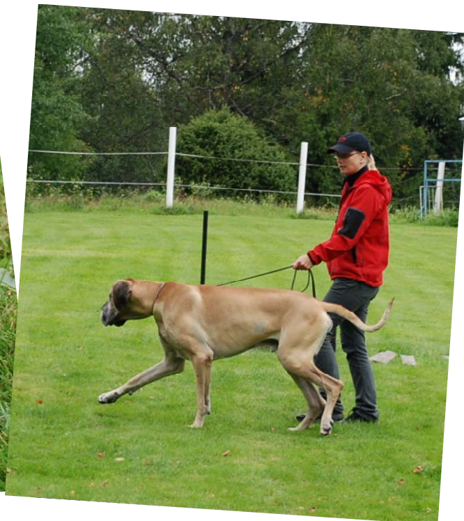
"Va, en utböling som vågar sig in här!"