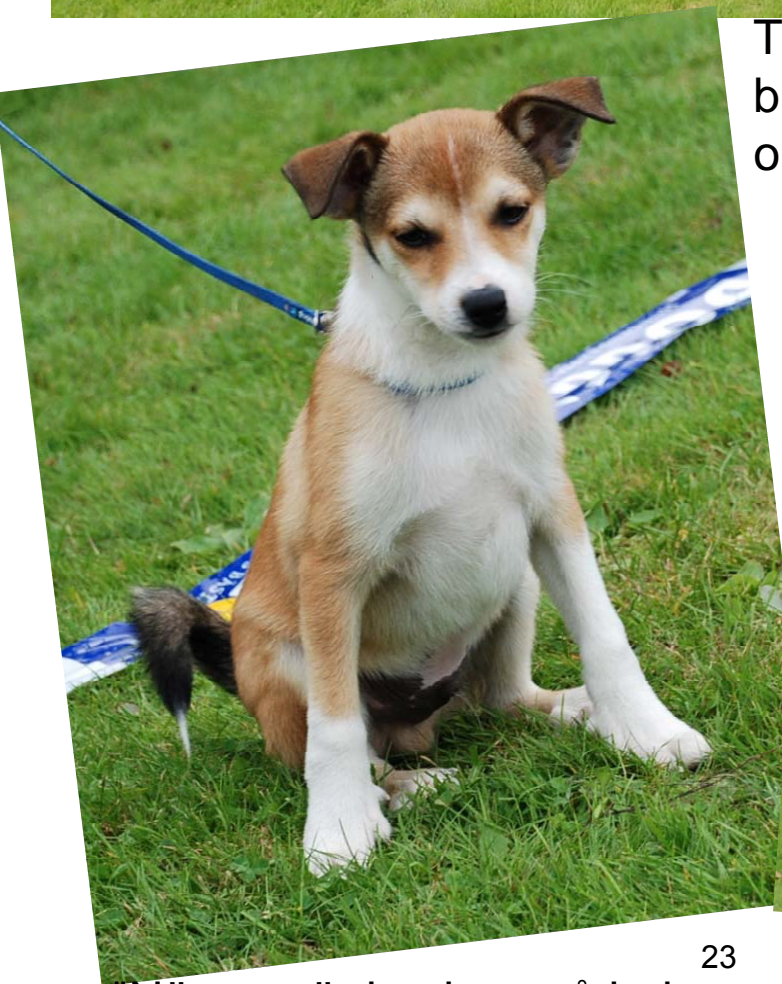
"Näe, nu är jag less på hela den här tillställningen."