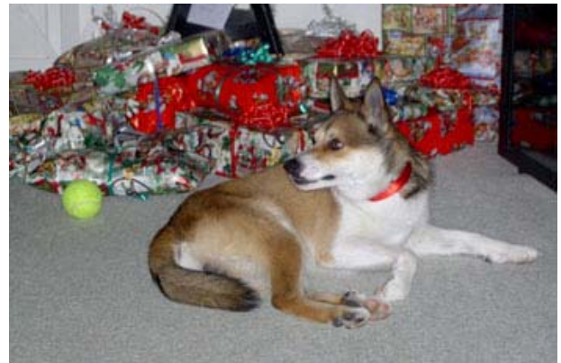
5 ½ -årige Lövheims Dvalin //Bo och Gull- Main Johnson