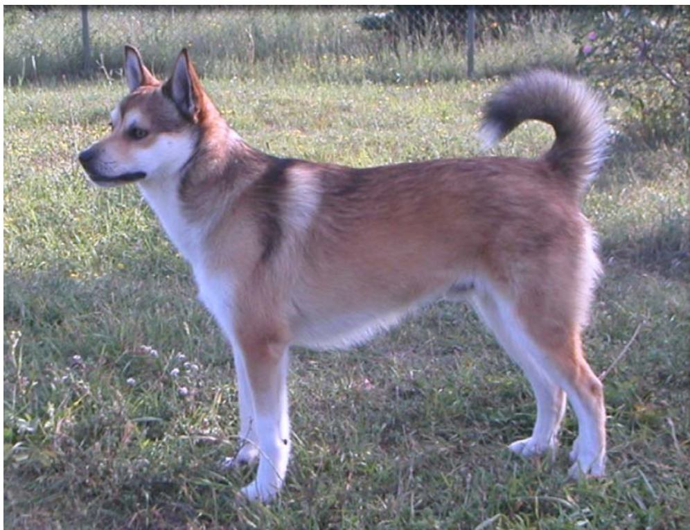
INT & NORD & FINUCh Paluna's Skoll Herason