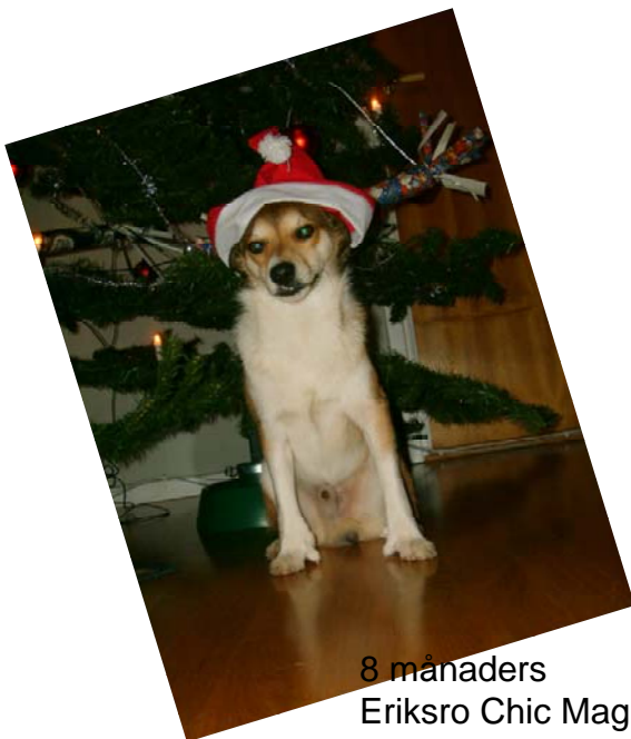
8 månaders Eriksro Chic Magic //Malin