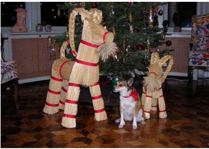
8-årige Smilla SUCH SKUCH INTUCH Boromir Engla Eiktyrner //Annika Turitz Garnaeus