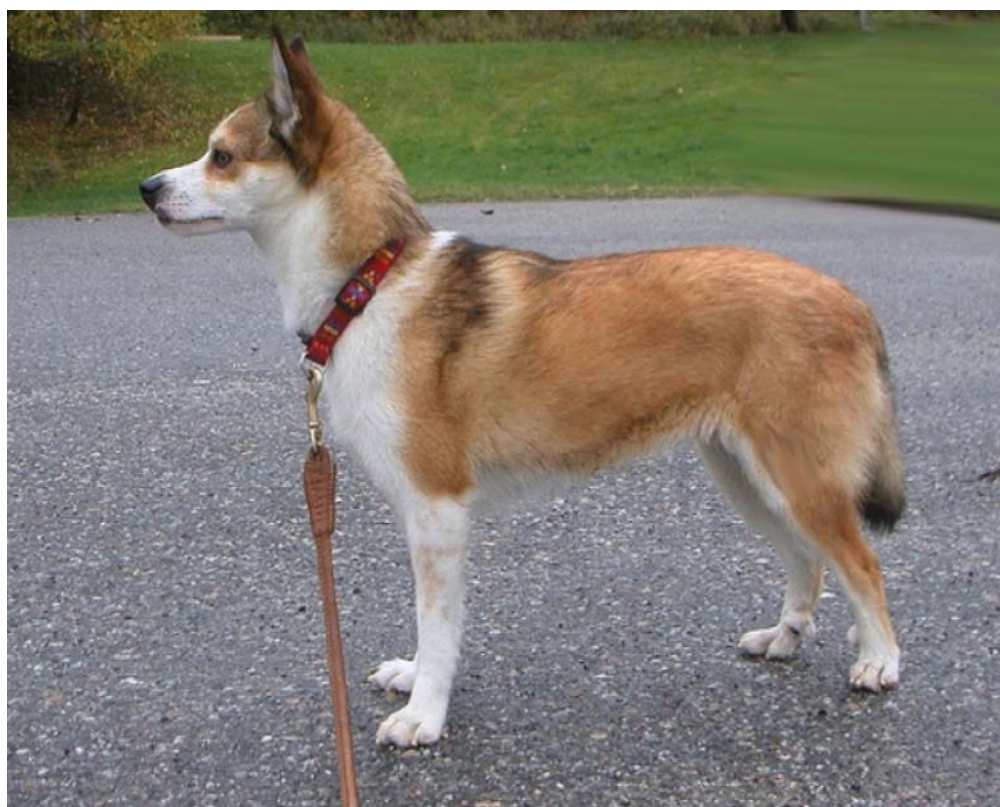
(NUCh NV-05 Dykebo's Miklagard - Int & NORDUCh Linesviken's Hera)