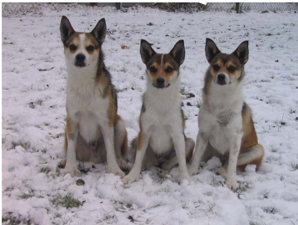
Mountjoy Spralliga Sune, Kung Sunes Lovis, Huldra av Vinterskogen