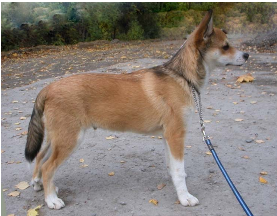
INT & NORD & FINUCh KBHV-00 Paluna's Freke

(Møstertunet's Mikkel - NUCh SUCH Paluna's Raija)