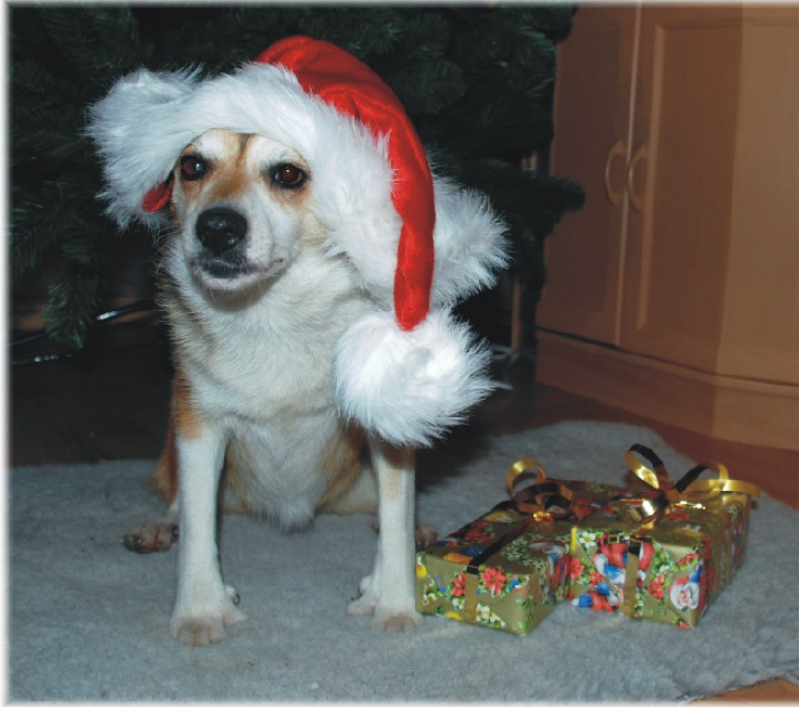
INT S FIN N UCH SV-07 ESTVV-07 Silversound's Ella-Cinderella BIS-4 veteran Turku Top Dog Show 2007

2007 har för kennel Eriksro varit ett händelserikt år. Ett par valpkullar har fötts, några champions har det blivit.