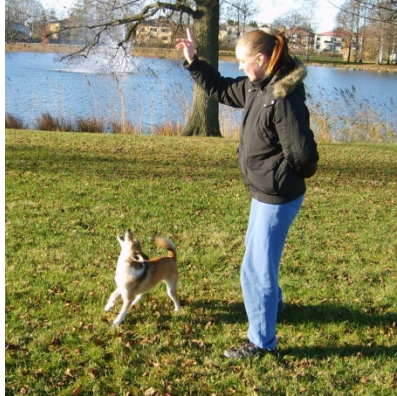
Magic "vänder om".

Sen finns det olika positioner man kan ha med, i klass 1 är ju minst ett positionsarbete obligatoriskt!