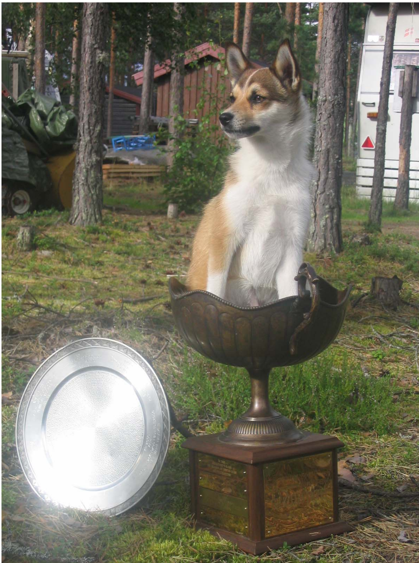
BIR-Valp Morokulien den 28/7 & 29/7 Kung Sunes Lovis