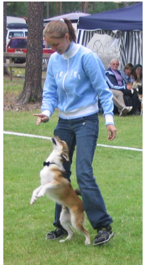
Maja & Senja av Vinterskogen med sin fina vagn.

Malin & Magic i en härlig dansuppvising.