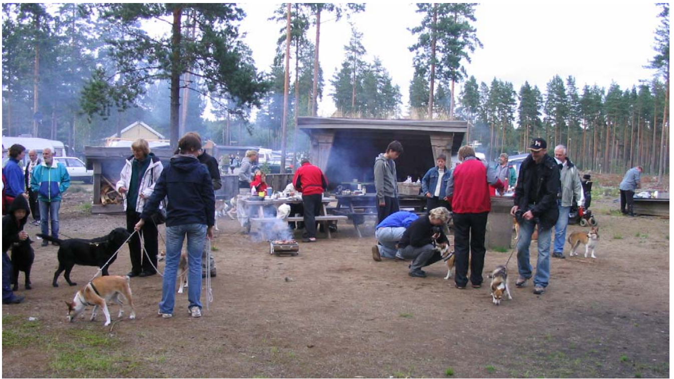
Fredag kvälls grillafton på Montobello Camping.

Efter en spännande valpshow på lördagen var det 15 valpar som fick slåss om dom 5 platser för att sedan få en vinnande etta.