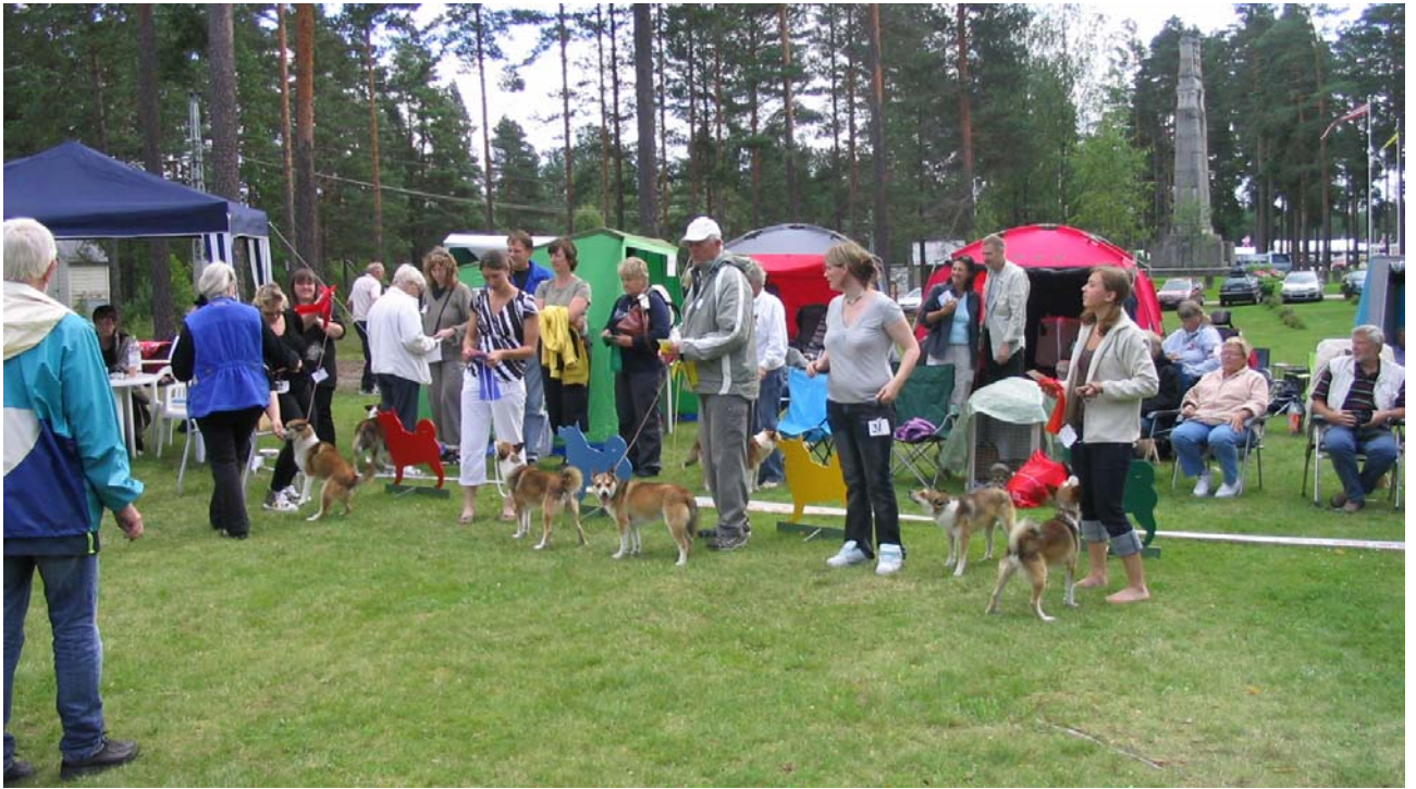
Lite oreda i ledet hos hannarna på lördagens utställning.