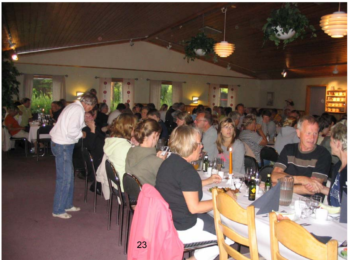
Efter en lång dag var middagen varmt välkommen på Vårdshuset.