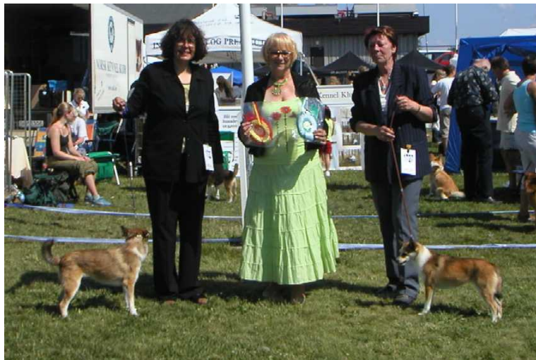
DKUCh SUCH FINUCh Paluna's Skoll Herason BIR, CERT, CACIB, NUCh, IntUCh