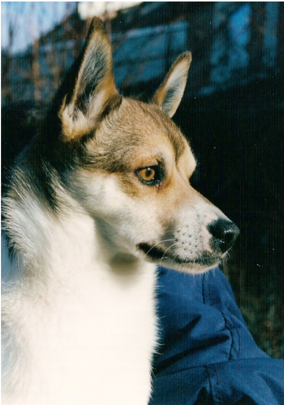
S UCH Pluto