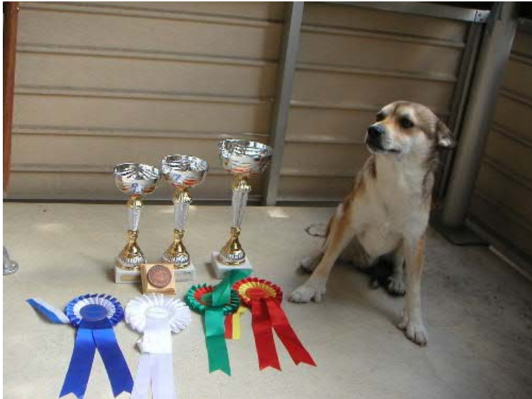
DKUCh SUCH Paluna's Skoll Herason BIR, CERT, CACIB, FINUCh, NordUCh