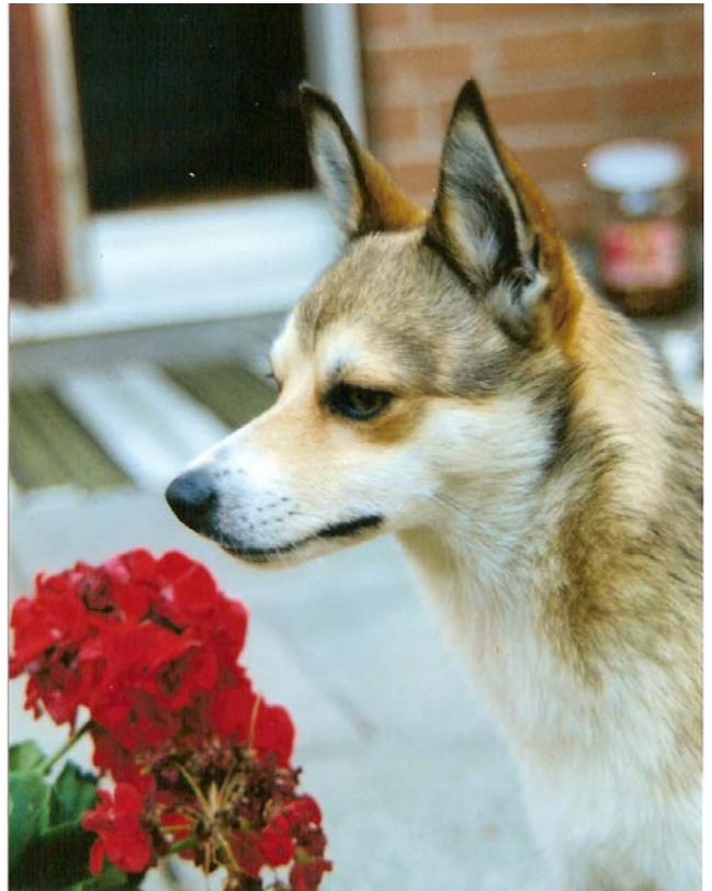
Boromir Miranda Mångull "Tassan"

5 valpar såg kvällsmånens ljus 2006-11-21; det blev 2 killar och 3 tjejer! En hanvalp till salu - kontakta Siv Kvarnström / 0171-470050 (kvällar) eller tikägaren Birgitta Ånséhn / 08-997586. Tack Gittan för att du tog ner månen åt mig och lät mig låna Tassan ännu en gång!