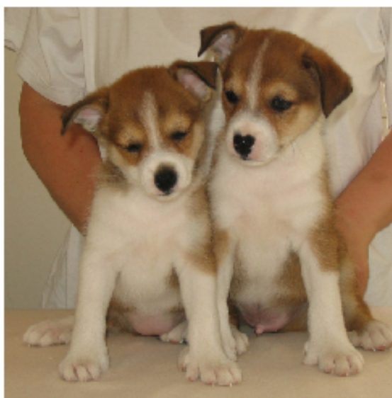
Mountjoy Zöta Zezilia & Mountjoy Ztiliga Zigge E. Aspheims Trollunge U. Mountjoy Xofistikerade Xonja